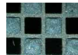
Schonende Reinigung bei Mercedes-Benz