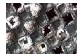
Schädigung durch falsche Reinigung